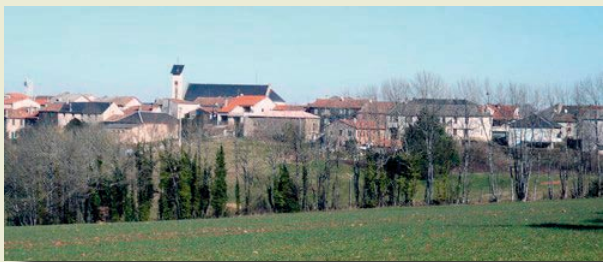
ALBAN - TARN (81)