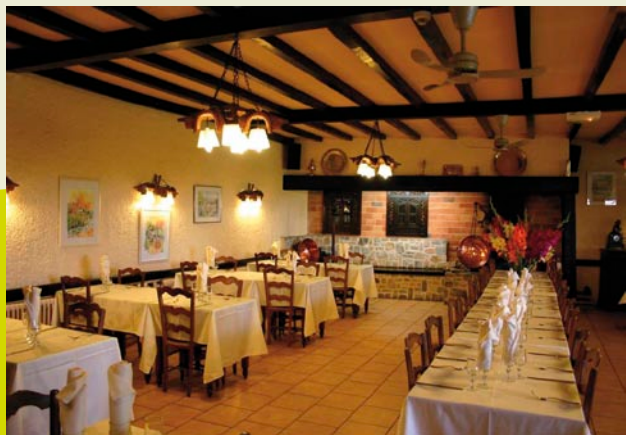
Salle de réception 120 couverts Conference and reception facilities