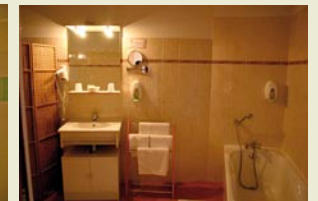
Un petit hôtel de 11 chambres vous attend. A cosy 11 rooms hotel awaits you.