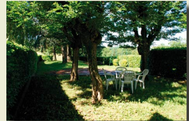
Jardin ombragé à votre disposition. Take advantage of the shaded garden.